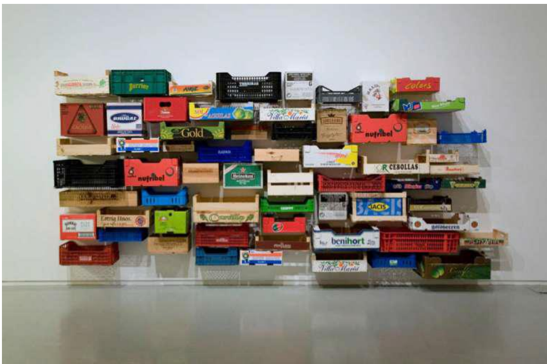
La Calaixera (2003) Curro Claret

http://historiasdevida2013.wordpress.com/