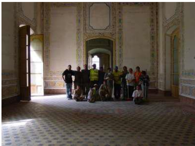
Proyecto Casa Dalmases, Cervera

http://historiasdevida2013.wordpress.com/