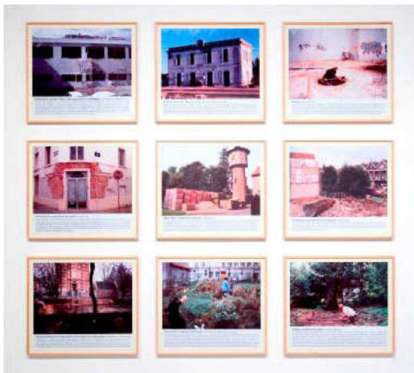
Demoliciones, descampados y huertas urbanas. (1995–2000)

http://historiasdevida2013.wordpress.com/